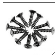
Black plastic sprayed screws included