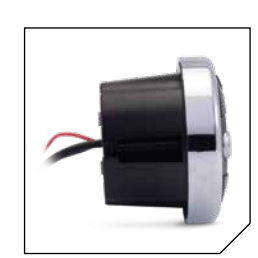
Partially submerged mounting